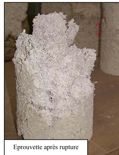
Eprouvette après rupture

Notons que cette résistance dépend très fortement du malaxage et du compactage, ce qui nous laisse espérer une amélioration sensible de la limite d'élasticité des blocs préfabriqués, vu la qualité de ces opérations lorsqu'elles sont industrialisées.