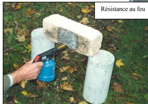
Résistance au feu